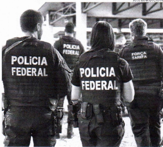
A seleção dos mais procurados segue a matriz de risco nacional